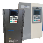
Inversor de frequência PI150 - 5 a 800CV / 220V~440V